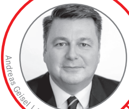
Andreas Geisel

Die Veranstaltung steht allen Interessierten offen. Der Eintritt ist frei. Eine verbindliche Anmeldung ist erforderlich.*