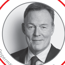
Thomas Oppermann